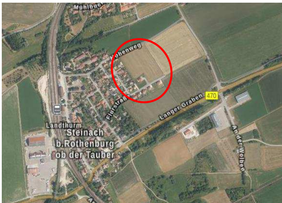
Abb. 1: Lage im Raum

Das Plangebiet liegt am östlichen Ortsrand des Ortsteiles Steinach b. Rothenburg o. d. Tauber der Gemeinde Gallmersgarten.